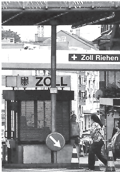
WECHSELKURS EURO FRANKEN

Resistent. Bisher hat der starke Euro die Grenzgänger nicht vom Arbeitsgang in die Schweiz abgehalten. Grafik baz