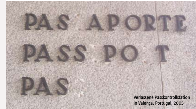
Verlässene Passkontrollstation in Valença, Portugal, 2005