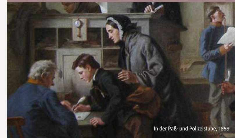
In der Paß- und Polizeistube, 1859

Eine Fachtagung des Deutschen Auswandererhauses und des Amtsgerichts Bremerhaven vom 15. bis 16. Mai 2008